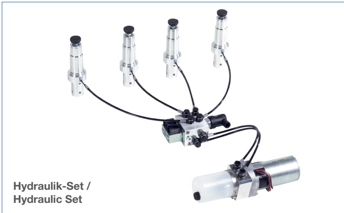
Hydraulik-Set / Hydraulic Set